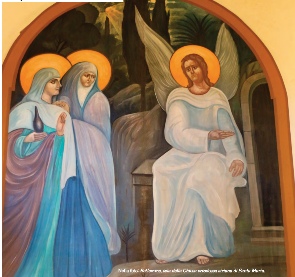
Nella foto: Betlemme, tela della Chiesa ortodossa siriana di Santa Maria.

casa, perché ci apra a una preghiera universale. La sera della Veglia, aspetteremo il buio per accendere una luce, e leggere la Parola di Dio che fa uscire il mondo dal caos (Creazione), dalla schiavitù (Esodo), dall'esilio (Isaia) e dalla morte (Vangelo). Il segno dell'acqua, che è memoria della nostra risurrezione iniziata nel battesimo, può recuperare una antica tradi-